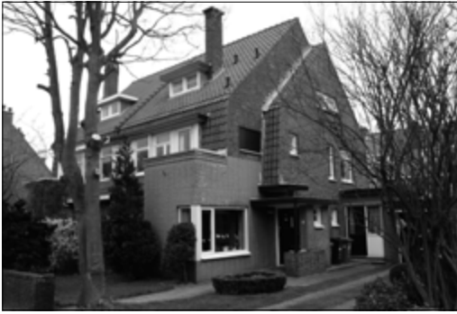
Het ouderlijk huis aan de Spotvogellaan.

je bijvoorbeeld op een holletje naar de rechtbank om een andere cliënt bij te staan.”